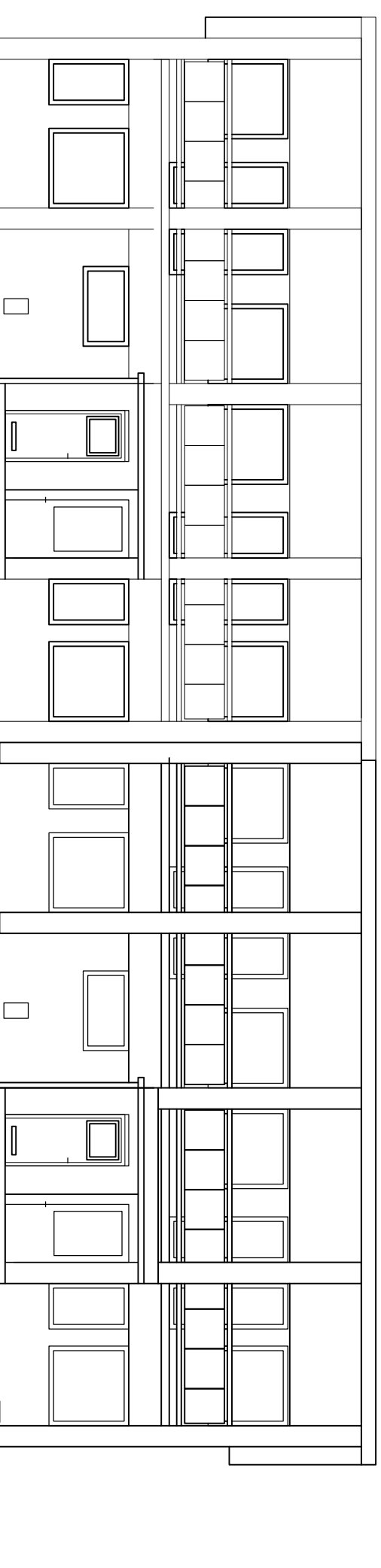
ELEWACJA TYLNA 1:100